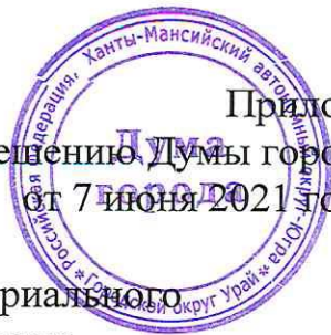
Схема границ территории территориального общественного самоуправления (городской округ Урай, микрорайон 2, район многоквартирных жилых домов № 64, № 65, №104, № 105)

Приложение 2 к решению Думы города Урай от 7 июня 2021 года № 42