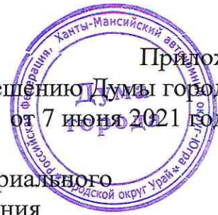
Схема границ территории территориального общественного самоуправления

Приложение 2 к решению Думы города Урай от 7 июня 2021 года № 41